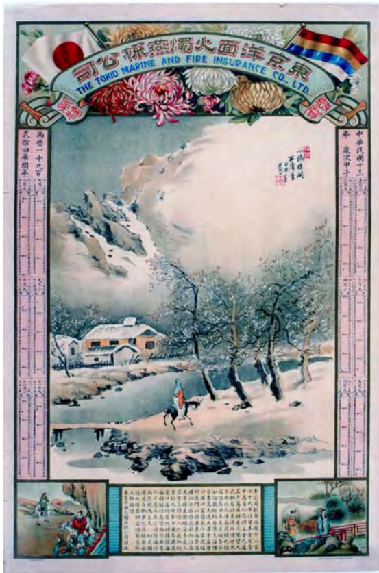
東京洋面火燭燕梳公司月份牌 香港 1924 年 長 77 厘米 闊 51 厘米