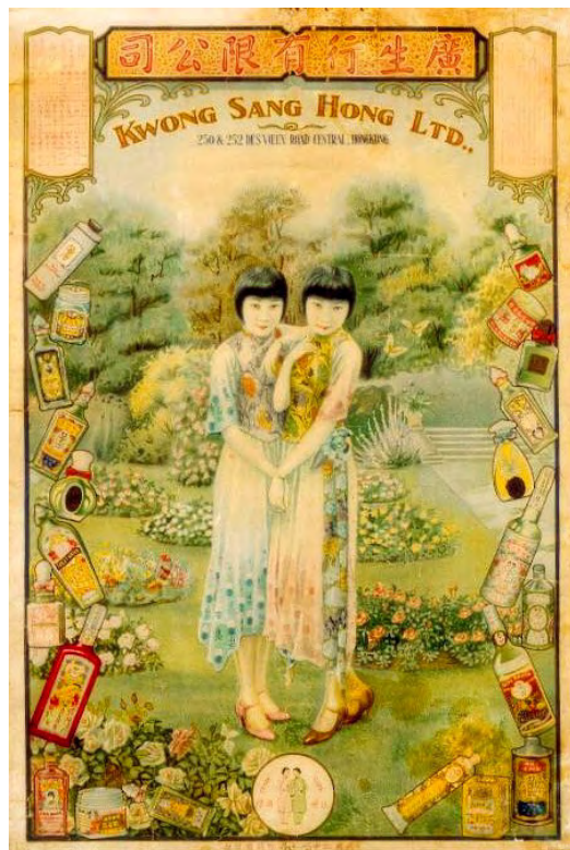
廣生行有限公司海報