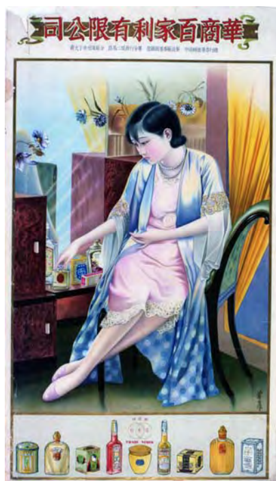
華商百家利有限公司海報 香港 1920 年代至 1930 年代 長 89.5 厘米 闊 51 厘米

本文以活躍於二、三十年代的商品廣告海報畫師、有月份牌王之稱的關蕙農為重心，透過其手稿、海報及相關照片，介紹關氏創作廣告海報的特色，闡述其創辦的亞洲石印局，以及當時流行的石版印刷技術。