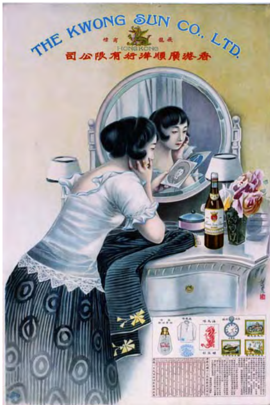
香港廣順洋行有限公司月份牌 香港 1924年至1925年 長 76.7 厘米 闊 51 厘米