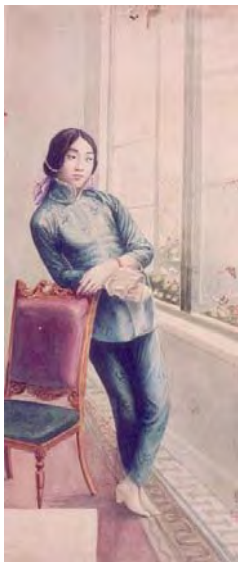
美女圖手稿 香港 1920 年代至 1930 年代 長 71.8 厘米 闊 31.2 厘米