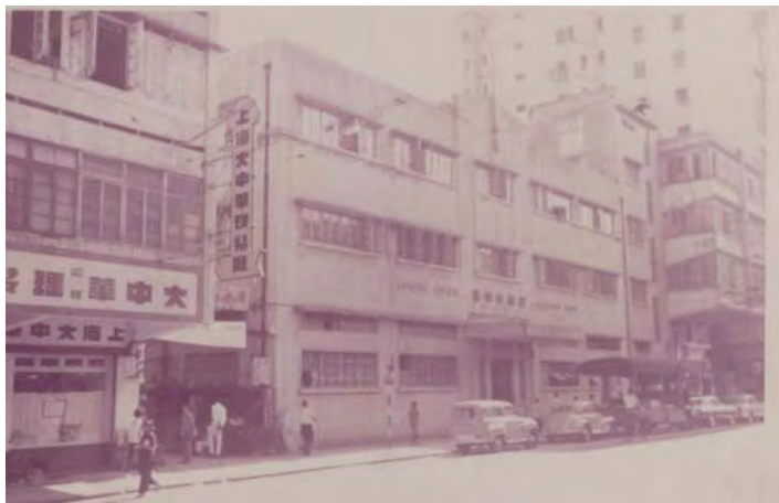
約 1950 年代位於北角英皇道的亞洲石印局

戰後，關蕙農將業務交予兒子關祖謀及關祖良。其時，亞洲石印局亦已轉用新式的柯式印刷。七十年代，北角廠房拆建為亞洲大廈，石印局遂遷往同區的東祥大廈。直至八十年代末，亞洲石印局隨關祖良退休而暫時結束。1990 年關祖良姪兒關秉剛回港，再以亞洲石印局之名，於柴灣復業，至 1998 年結業。