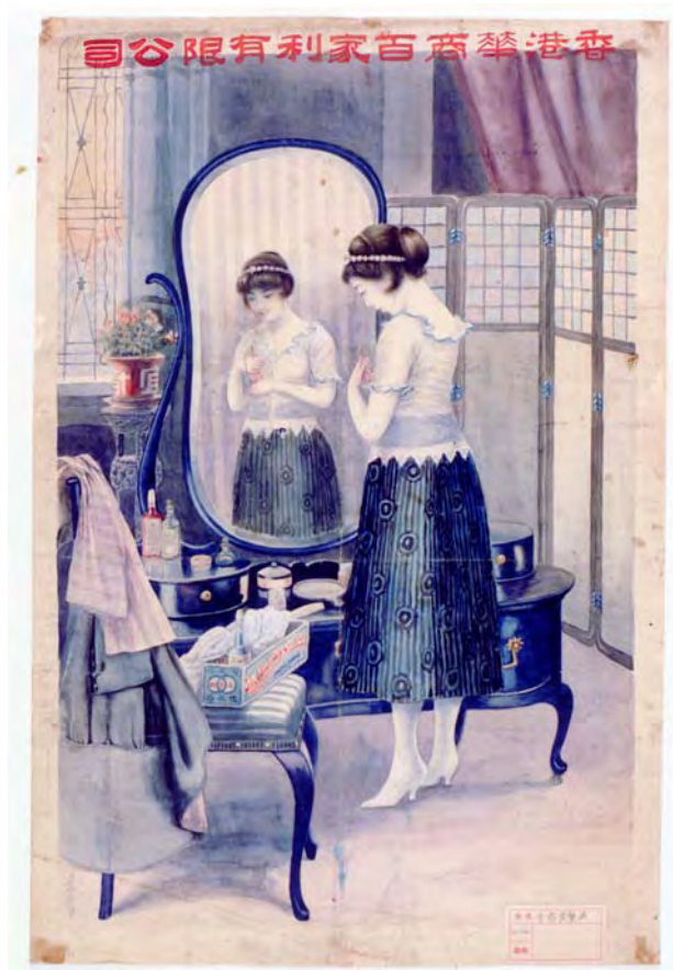
香港華商百家利有限公司海報手稿 香港 1920年代至1930年代 長 74.8 厘米 闊 49.5 厘米