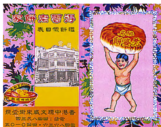
得雲老餅家招紙 香港 1960 年代 長 15.5 厘米 闊 25.5 厘米