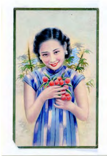
手抱荔枝美女圖手稿 香港 1920 年代至 1930 年代 長 20 厘米 闊 12 厘米