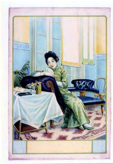
美女圖月份牌手稿 香港 1920 年代至 1930 年代 長 76.3 厘米 闊 50.9 厘米