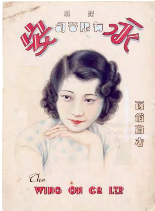
永安有限公司海報手稿 香港 1920年代至1930年代 長 20 厘米 闊 12 厘米