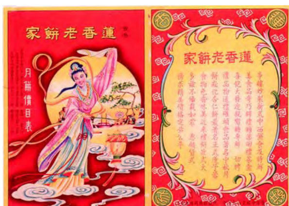
香港蓮香老餅家招紙 香港 1960 年代 長 19.3 厘米 闊 26.9 厘米