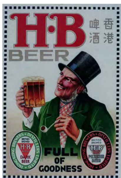
香港啤酒廣告畫 香港 1920 年代至 1930 年代 長 81.5 厘米 闊 57 厘米