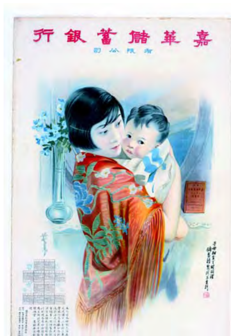
嘉華儲蓄銀行有限公司月份牌 香港 1920 年代至 1930 年代 長 76.5 厘米 闊 52 厘米