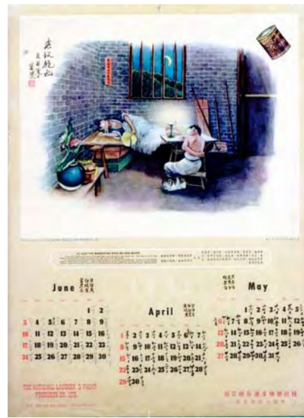
國民漆廠有限公司月份牌 (局部) 香港 1951 年 長 53.5 厘米 闊 38 厘米 (每張)

國民漆廠送予客戶的月份牌，選取中國民間故事——「二十四孝」為主題，輔以「駱駝漆」圖案，兼具實用與宣傳之效。