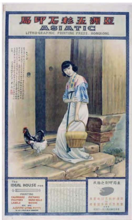
亞洲五彩石印局月份牌