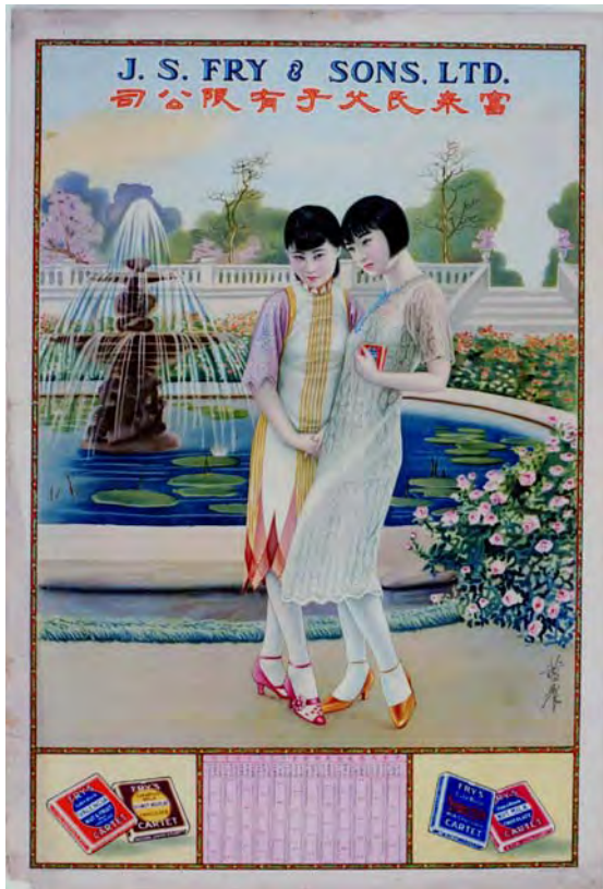
富來氏父子有限公司月份牌 香港 1931 年 長 76.5 厘米 闊 51.5 厘米