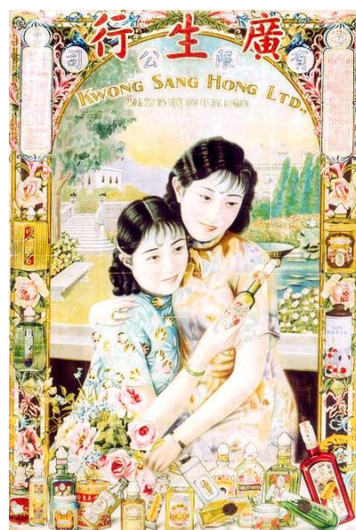
廣生行有限公司海報 香港 1933 年 長 71.5 厘米 闊 49 厘米