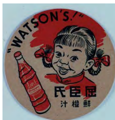
屈臣氏鮮橙汁杯墊 香港 1920 年代至 1930 年代 直徑 9 厘米