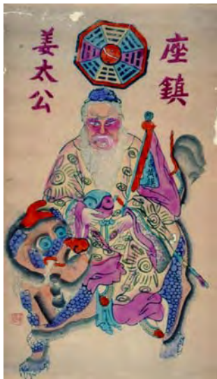
姜太公 廣東佛山 1950年代至1960年代 長 59 厘米 闊 33.7 厘米