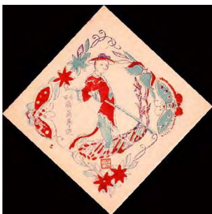
燈畫 — 划船