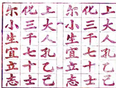
印版及描紅帖 (舊版重印)