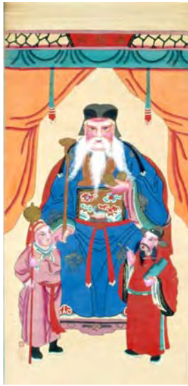
土地公 廣東佛山 1950年代至1960年代 長 130.5 厘米 闊 63.3 厘米