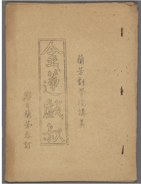
蘭芳劇學院講義 劇目：《金蓮戲叔》 1940 年代初 2011.7.1116