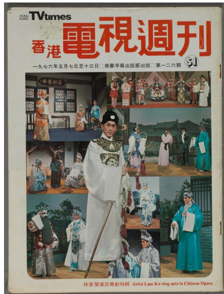
《香港電視週刊》第 126 期 內載林家聲粵劇特輯的報導 1976 年 2010.28.174