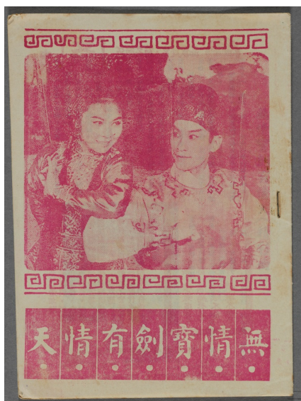
《無情寶劍有情天》電影特刊 1964 年 4 月 28 日首映 2010.46.46