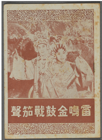
《雷鳴金鼓戰笳聲》電影特刊 1963 年 2 月 20 日首映 2010.46.93

林家聲對粵劇舞台藝術的熱忱，並未因銀幕上的成功而減少，反之，為了專注舞台表演，1966 年林家聲拍罷最後一套電影後，便告別影壇。