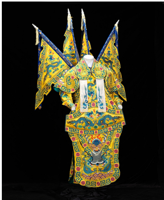
黃地繡龍紋大靠 林家聲在《雷鳴金鼓戰笳聲》〈三貶〉一幕所穿戲服。 1980 年至 1990 年代 2011.7.1176