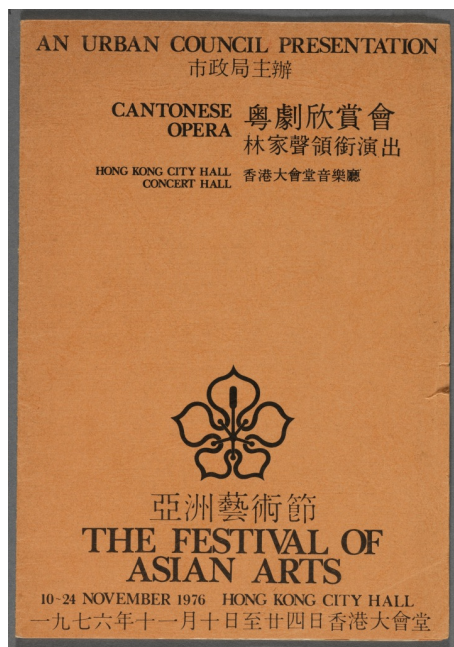
《第一屆亞洲藝術節》「粵劇欣賞會」演出場刊 劇目：《周瑜》 1976 年 2010.28.56