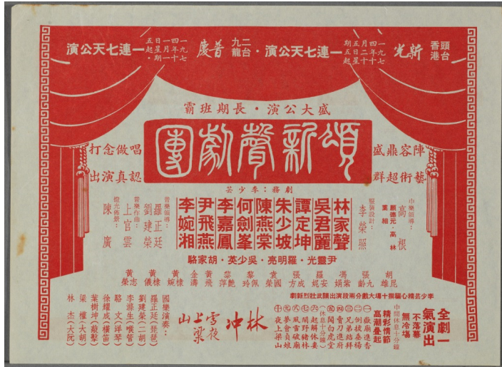
「頌新聲劇團」戲橋 劇目：《林冲雪夜上梁山》 1974 年 2010.46.21